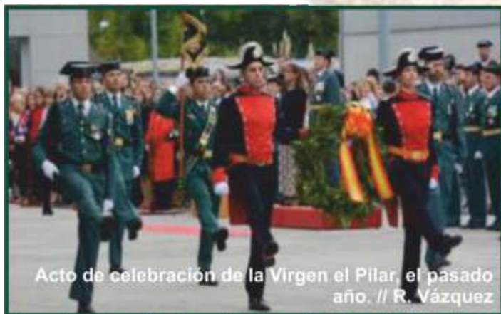
Acto de celebración de la Virgen del Pilar, el pasado año.

festividad, se agradecen todas las muestras de cariño y cercanía que reciben las unidades de la Guardia Civil por estas fechas, reiterando el compromiso de proximidad y prontitud para prestar el mejor servicio a la ciudadanía", apuntan desde la Comandancia.