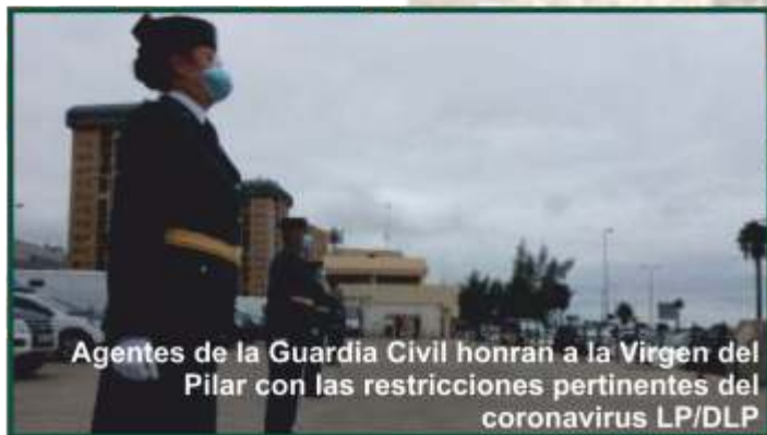
Agentes de la Guardia Civil honran a la Virgen del Pilar con las restricciones pertinentes del coronavirus

- Debido a las restricciones por el covid-19, la Comandancia de Las Palmas no ha podido realizar el tradicional desfile para enaltecer a su Patrona.