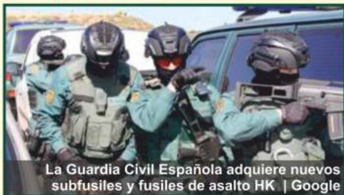
La Guardia Civil Española adquiere nuevos subfusiles y fusiles de asalto HK | Google

Los medios especializados no han dejado pasar la noticia de que la Guardia Civil Española ha adquirido un importante número de fusiles de asalto y subfusiles. Los agentes de la Guardia Civil recibirán con esta nueva compra armas fabricadas por la empresa alemana HK, que sigue siendo la proveedora casi oficial de las fuerzas de seguridad del Estado Español. Los fusiles de asalto que se han comprado ha sido 630, y lo subfusiles 110.