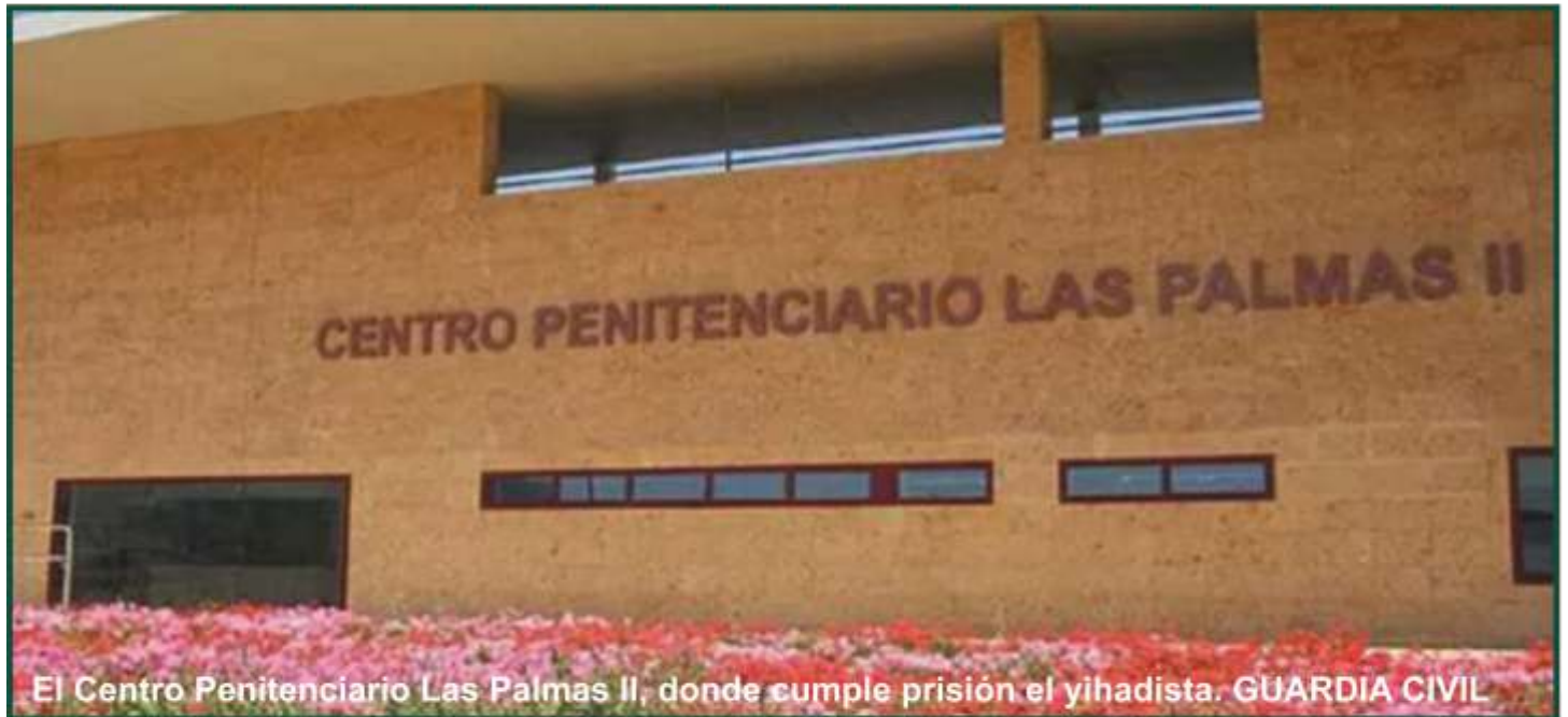
El Centro Penitenciario Las Palmas II, donde cumple prisión el yihadista.

- Se habían detectado gestiones para formar una célula radical y conseguir armas de fuego con las que perpetrar una acción en España.