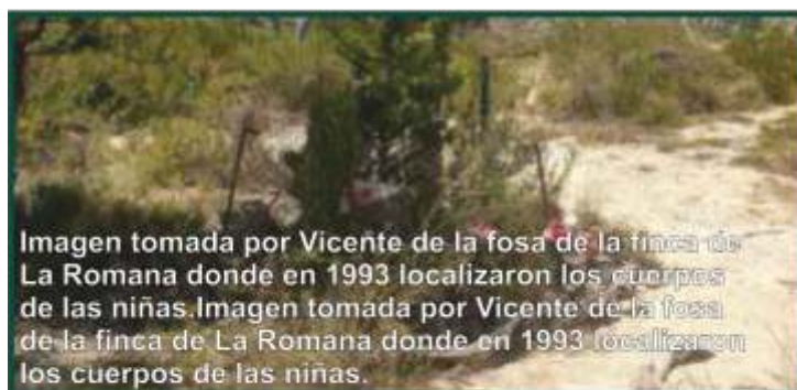
Imagen tomada por Vicente de la fosa de la finca de La Romana donde en 1993 localizaron los cuerpos de las niñas. Imagen tomada por Vicente de la fosa de la finca de La Romana donde en 1993 localizaron los cuerpos de las niñas.

—Yo considero que allí hay más restos. Es una opinión, no tengo una certeza. Creo que deberían revisar la zona y hacer un buen