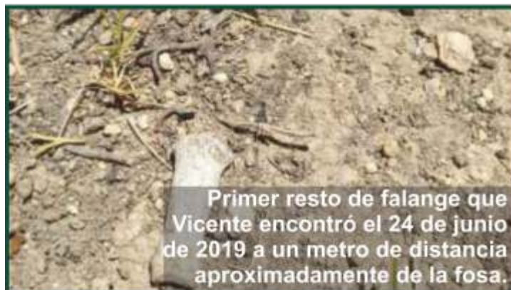
Primer resto de falange que Vicente encontró el 24 de junio de 2019 a un metro de distancia aproximadamente de la fosa.

— ¿Después de ver el documental que impresión le transmitió pisar el paraje de La