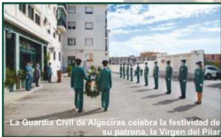
La Guardia Civil de Algeciras celebra la festividad de su patrona, la Virgen del Pilar

La celebración tuvo lugar el pasado día 9 de octubre en el patio central de la Comandancia. Allí se realizó un sencillo acto militar al que asistió una representación minoritaria de las diferentes escalas del Cuerpo.