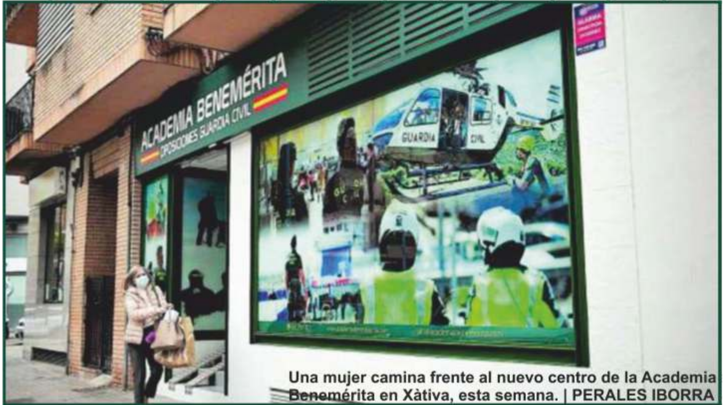
Una mujer camina frente al nuevo centro de la Academia Benemérita en Xàtiva, esta semana.

- La de la capital de la Costera es la segunda que abre la Benemérita en la provincia de Valencia después de la de la capital - La cifra de alumnos ha aumentado tras la ampliación del temario.