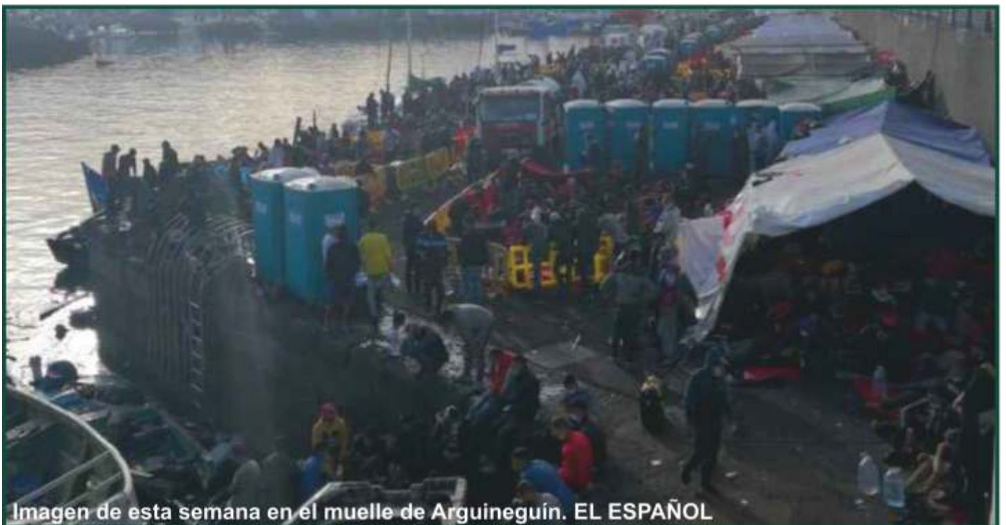
Imagen de esta semana en el muelle de Arguineguín.

"Esta ausencia de liderazgo en la utilización eficaz de los recursos de los departamentos implicados está provocando graves perjuicios en el servicio policial sin que, además, Interior ejerza su competencia exclusiva como órgano coordinador del trabajo de las diferentes Fuerzas y Cuerpos de seguridad", aseguraron. Ahora exigen de nuevo más personal, más recursos y más liderazgo por parte de las autoridades.