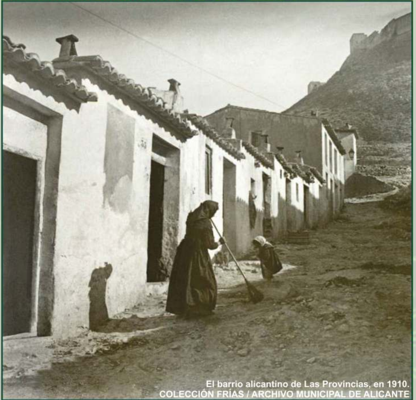
El barrio alicantino de Las Provincias, en 1910.

- En plena segunda ola de la gripe española, el alcalde ordenó desalojar y derribar las zonas más precarias, medida que contribuyó a diseminar el virus.