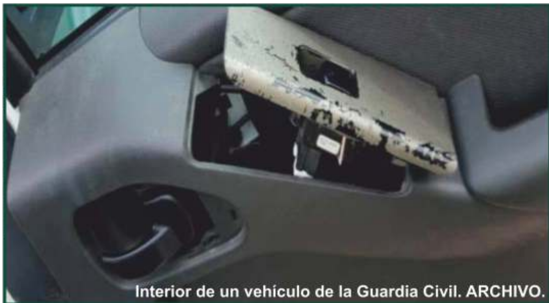
Interior de un vehículo de la Guardia Civil.

El Ejecutivo de Pedro Sánchez confirma en su respuesta que la "insuficiente" renovación de la