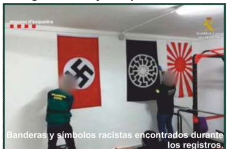
Banderas y símbolos racistas encontrados durante los registros.

Esta operación, dirigida por el Juzgado de Instrucción 4 de Lérida, es considerada por la Guardia Civil de especial relevancia dado «el creciente extremismo del nacionalismo blanco de ultraderecha, que supone una clara amenaza para la seguridad a corto y medio plazo»