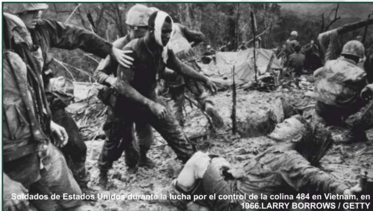
Soldados de Estados Unidos durante la lucha por el control de la colina 484 en Vietnam, en 1966.

- Cuando se cumplen 65 años del comienzo de la guerra de Vietnam, Mark Baker recoge en 'NAM' los testimonios de hombres y mujeres que lucharon en la guerra. Un relato coral y alucinante que se publica en España 39 años después.