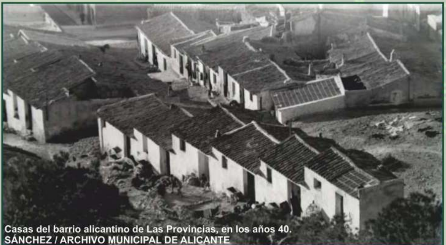
Casas del barrio alicantino de Las Provincias, en los años 40.

El estigma social no es el único parecido entre ambas emergencias sanitarias. La gripe española tuvo una primera oleada en primavera y afectó, principalmente, a Madrid y las dos Castillas, según Porras. La segunda, en otoño, fue peor y se desplazó hacia el Mediterráneo. “El movimiento de la población” durante el verano fue la clave. “Las vacaciones de la población, los traslados de los temporeros y de los quintos que iban a cumplir el servicio militar” expandieron el