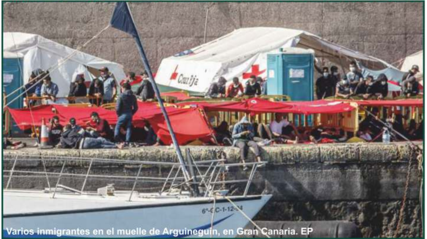
Varios inmigrantes en el muelle de Arguineguín, en Gran Canaria.

- En el sur de Gran Canaria, epicentro de la llegada de miles de inmigrantes, los agentes denuncian la gran cantidad de vacantes por rellenar.