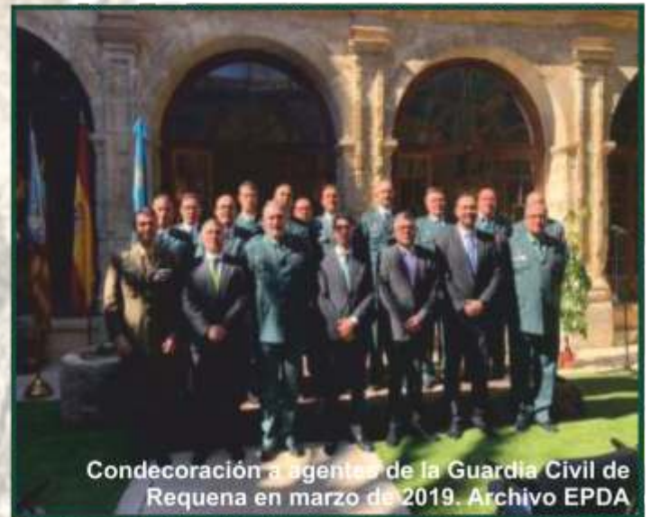
Condecoración a agentes de la Guardia Civil de Requena en marzo de 2019.

quedan suspendidos todos los actos oficiales que se venían desarrollando en años anteriores con motivo de la