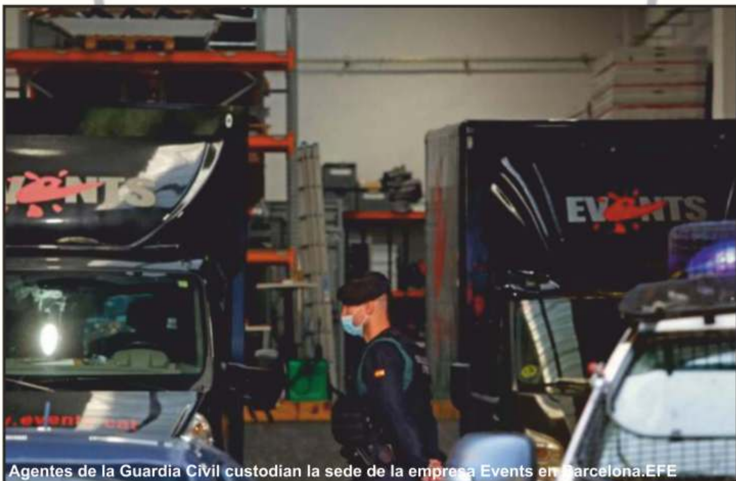
Agentes de la Guardia Civil custodian la sede de la empresa Events en Barcelona.

Tsunami Democràtic se sirvió de las redes sociales para convocar manifestaciones y protestas en las calles de Cataluña tras la sentencia del 1-O . Una de las protestas que convocó se produjo en el aeropuerto de El Prat , que fue una de las situaciones que se ha vivido en Cataluña durante todos los disturbios y que estuvo a punto de superar a las Fuerzas de Seguridad.