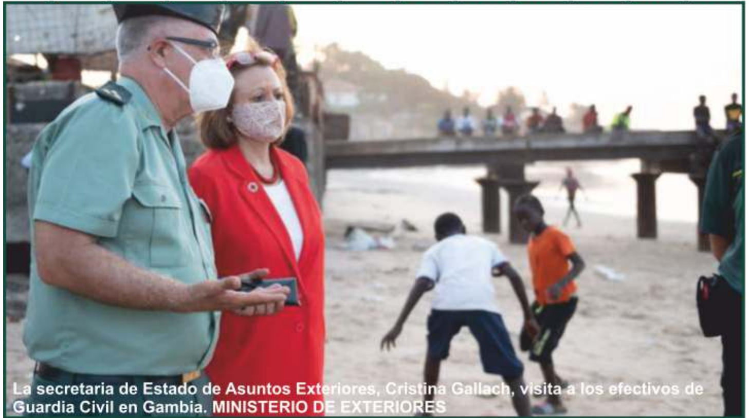
La secretaria de Estado de Asuntos Exteriores, Cristina Gallach, visita a los efectivos de Guardia Civil en Gambia.

- Gambia coopera para impedir la emigración irregular y lo que hay es falta de medios. Ahora, junto a la costa se oxida una de las patrulleras donadas por España hace más de 10 años.