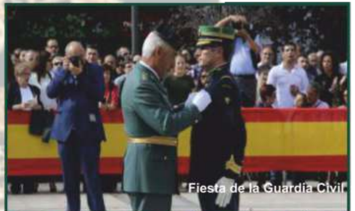
Fiesta de la Guardia Civil

Los responsables de la institución han señalado que la decisión se toma "para evitar situaciones de riesgo" relacionadas con el COVID, y han anunciado que sí se