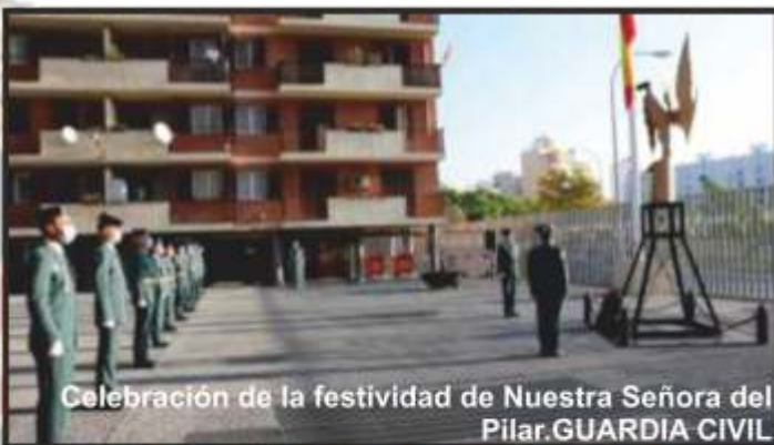
Celebración de la festividad de Nuestra Señora del Pilar.