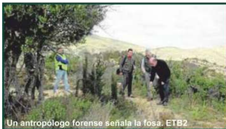
Un antropólogo forense señala la fosa. ETB2

También visionó El lector de Huesos . Este programa de la televisión autonómica vasca ETB2