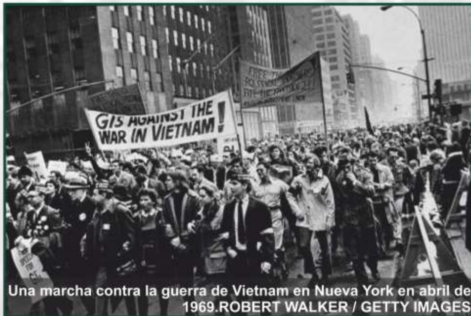
Una marcha contra la guerra de Vietnam en Nueva York en abril de 1969.

sin contar a nadie que habían ido a la guerra, sin llorar, reprimiendo sus sensaciones para que no se fuera todo al traste. Otros admiten que no querían volver, que sabían que nada bueno les esperaba fuera de Vietnam, que se habían vuelto adictos al horror. También se recogen los recuerdos de algunos boinas verdes, fuerzas especiales y otros soldados fuera de lo común, gente acostumbrada a vivir en el filo pero que, como dice Baker, “solo eran trabajadores cualificados dentro de la misma obra de demolición. Debajo de sus disfraces y maquillajes, detrás de la fanfarronería no había más que otro grupo de soldados rasos asustados y bañados en sudor”.