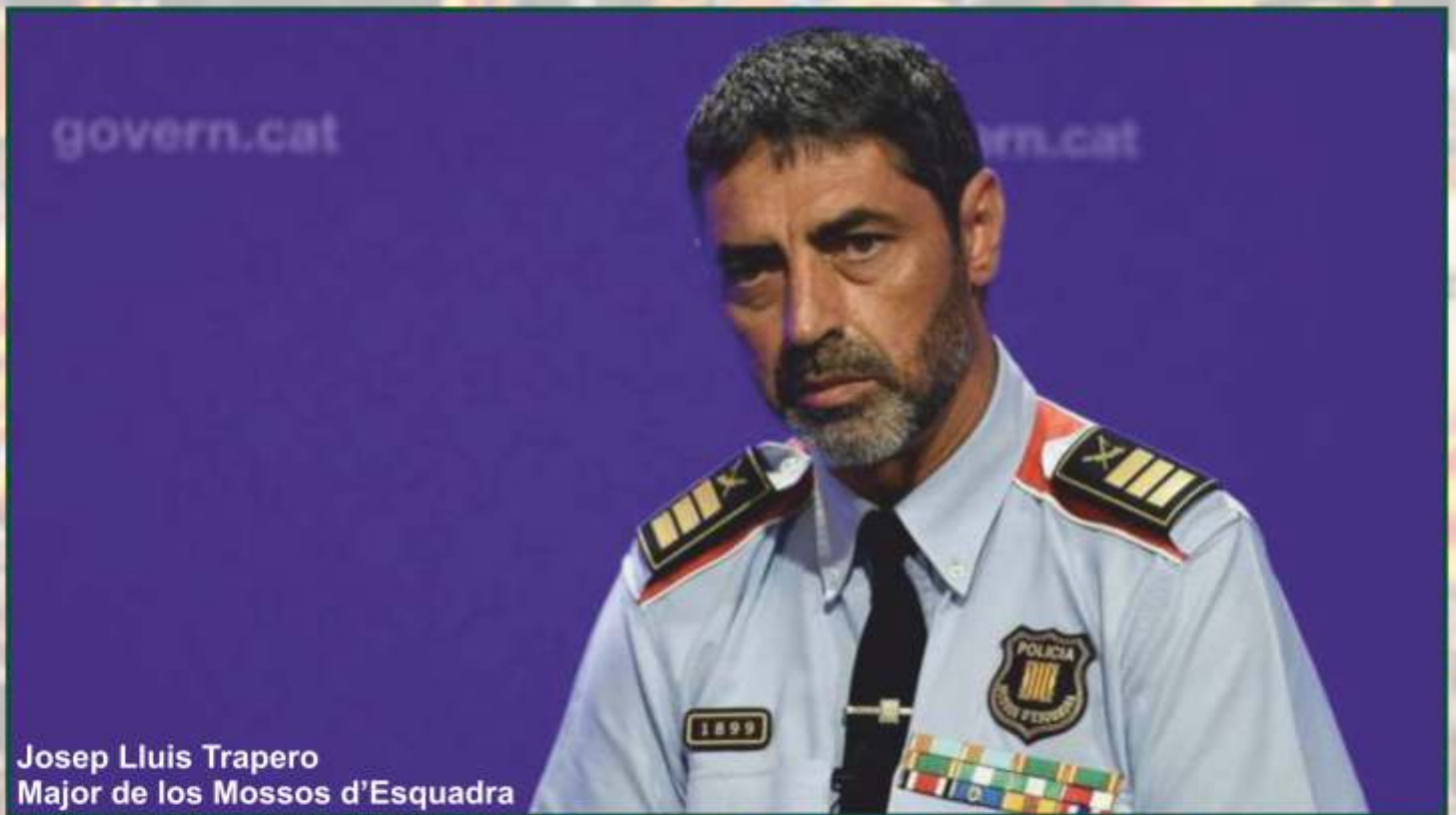
Josep Lluís Trapero Major de los Mossos d'Esquadra