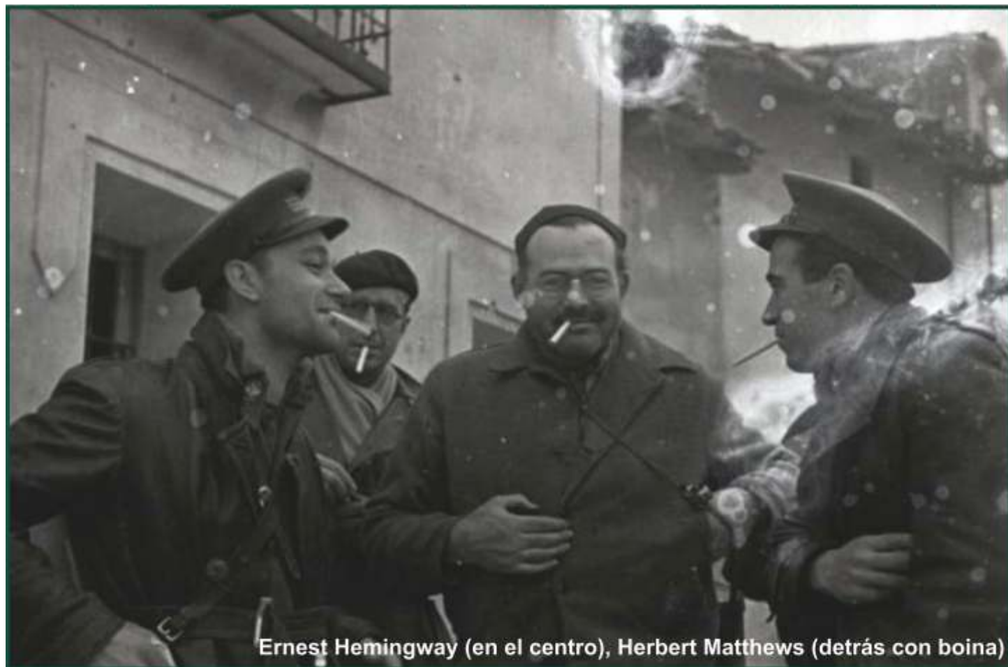
Ernest Hemingway (en el centro), Herbert Matthews (detrás con boina)

Hay batallas que pasan a la Historia por cambiar el curso de una guerra. Otras lo hacen por la épica o bien por la estrategia política que las rodeó. Y hay batallas, como la de Teruel, a las que hay que sumar la capacidad destructora del ser humano con el propio ser humano y, al mismo tiempo, su insignificancia frente a las circunstancias del mundo. Entre diciembre de 1937 y febrero de 1938 las tropas sublevadas de Franco y las gubernamentales de la República concentraron todos sus esfuerzos en la más pequeña de las capitales españolas. Para los republicanos se trataba de demostrar que podían arrebatarse terrenos a los golpistas. Para Franco, una afrenta imperdonable.