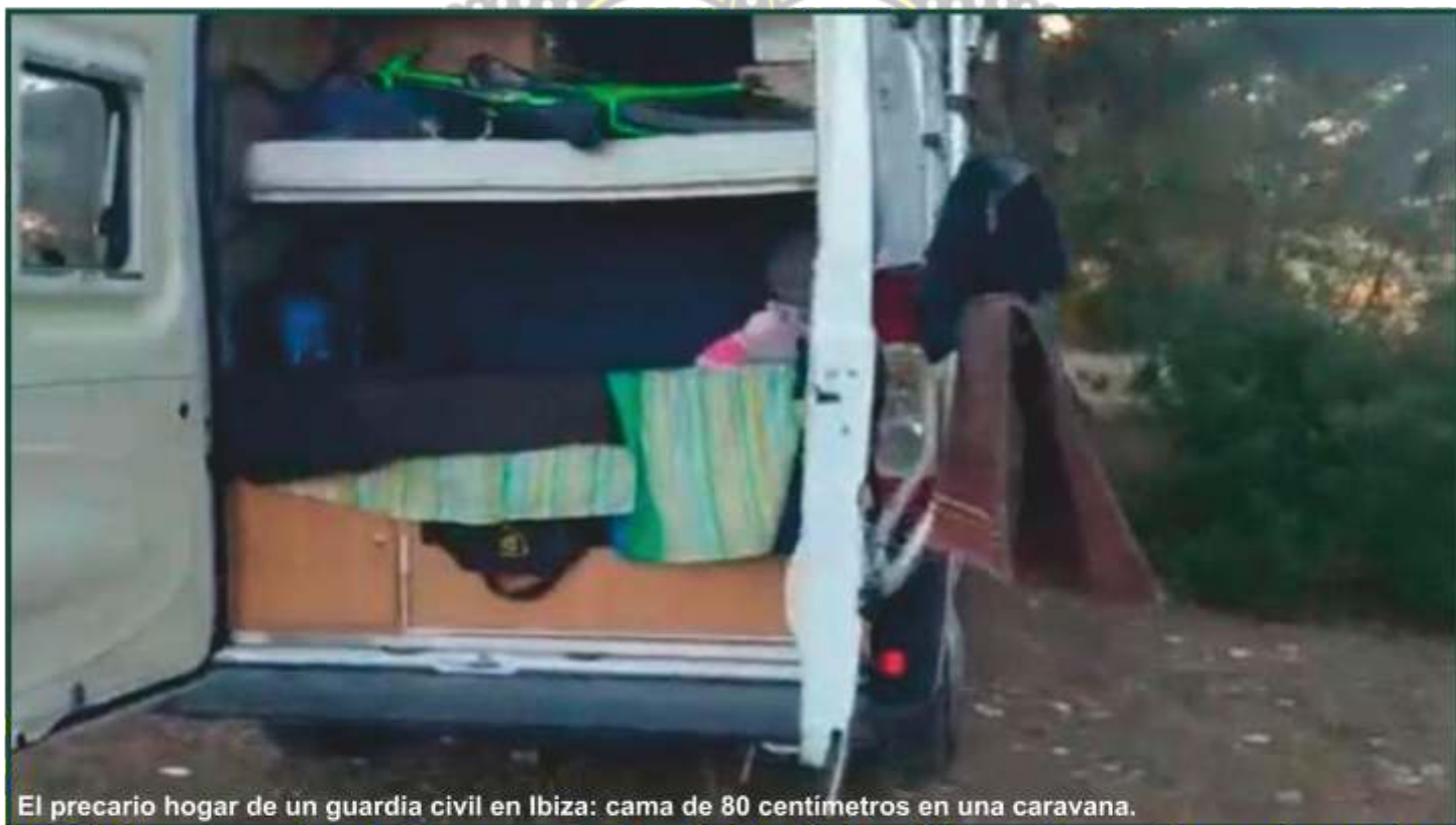
El precario hogar de un guardia civil en Ibiza: cama de 80 centímetros en una caravana.

- "Con nuestro sueldo es totalmente inviable alquilar un piso".