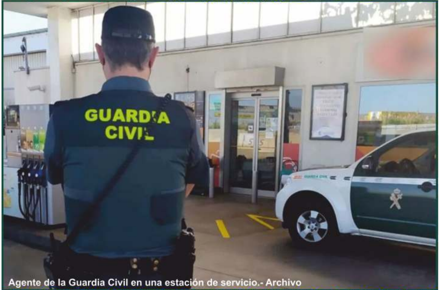
Agente de la Guardia Civil en una estación de servicio.

- Fue interceptado en un dispositivo policial cerca de la capital y disparó cuando le dieron el alto. Tras refugiarse en una gasolinera de Villagonzalo Pedernales, continuó disparando y acabó siendo abatido.