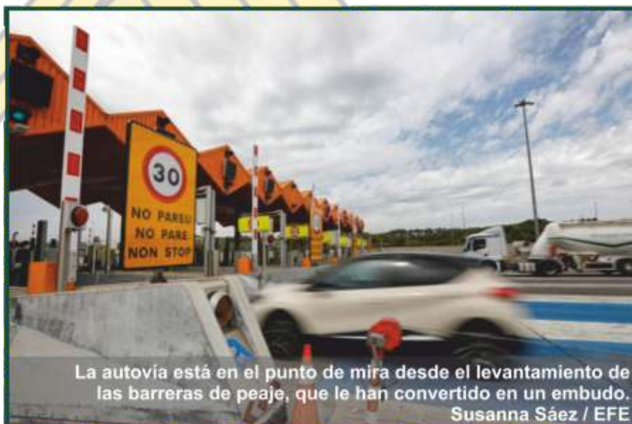
La autovía está en el punto de mira desde el levantamiento de las barreras de peaje, que le han convertido en un embudo.

Más allá de este incidente, Lamiel se mostró "relativamente satisfecho" por la evolución de la movilidad en las carreteras durante estas fechas, que acabó con menos retenciones que el año pasado.