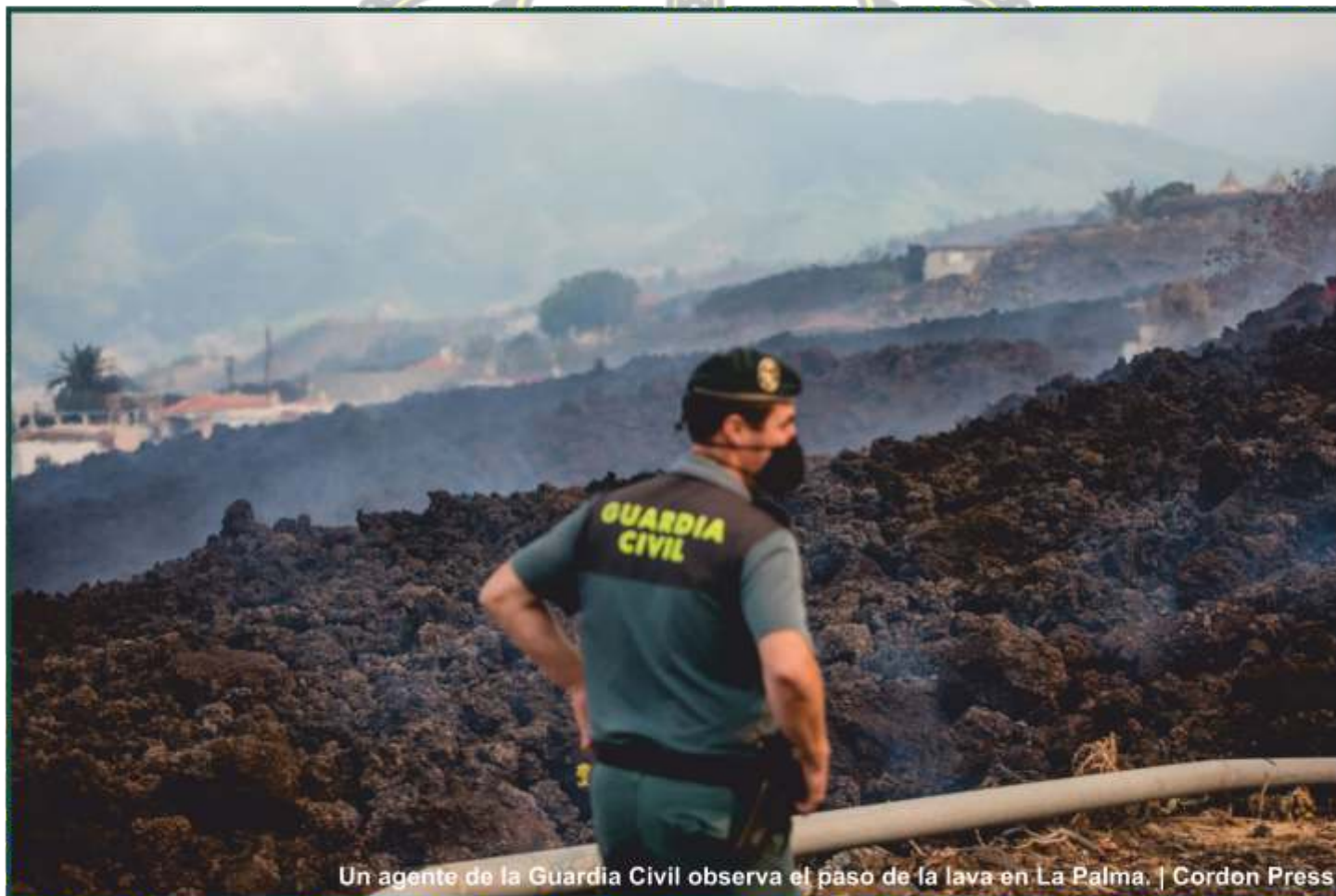
Un agente de la Guardia Civil observa el paso de la lava en La Palma.

- Escrita por el Duque de Ahumada, fundador del Cuerpo, la Cartilla se aprobó por Real Orden de Isabel II, publicándose el 20 de diciembre de 1845.