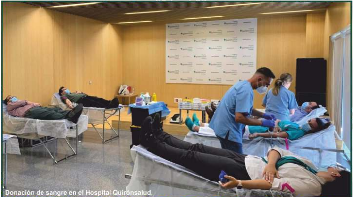
Donación de sangre en el Hospital Quirónsalud.

La Guardia Civil inicia la conmemoración de su 179º aniversario con una maratón de donación de sangre.