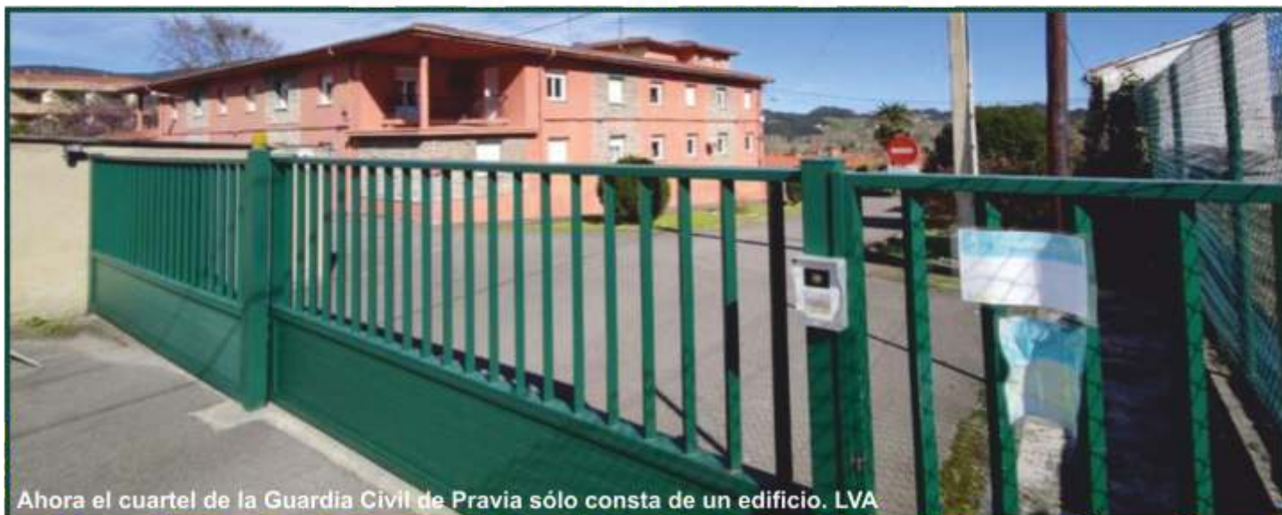
Ahora el cuartel de la Guardia Civil de Pravia sólo consta de un edificio.

- La redacción ya ha sido adjudicada y habrá un nuevo edificio para las dependencias oficiales y dos viviendas nuevas en la zona del gimnasio.