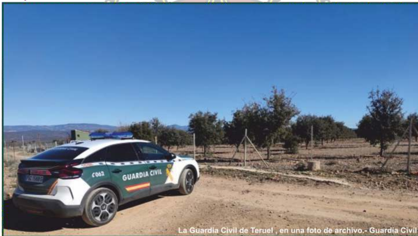
La Guardia Civil de Teruel, en una foto de archivo.

- El campo es el principal enemigo al que se enfrenta la Guardia Civil en la investigación de una desaparición.