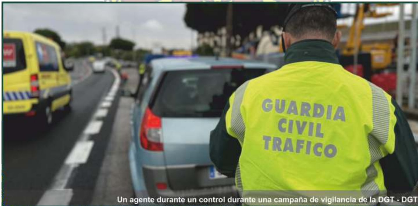
Un agente durante un control durante una campaña de vigilancia de la DGT