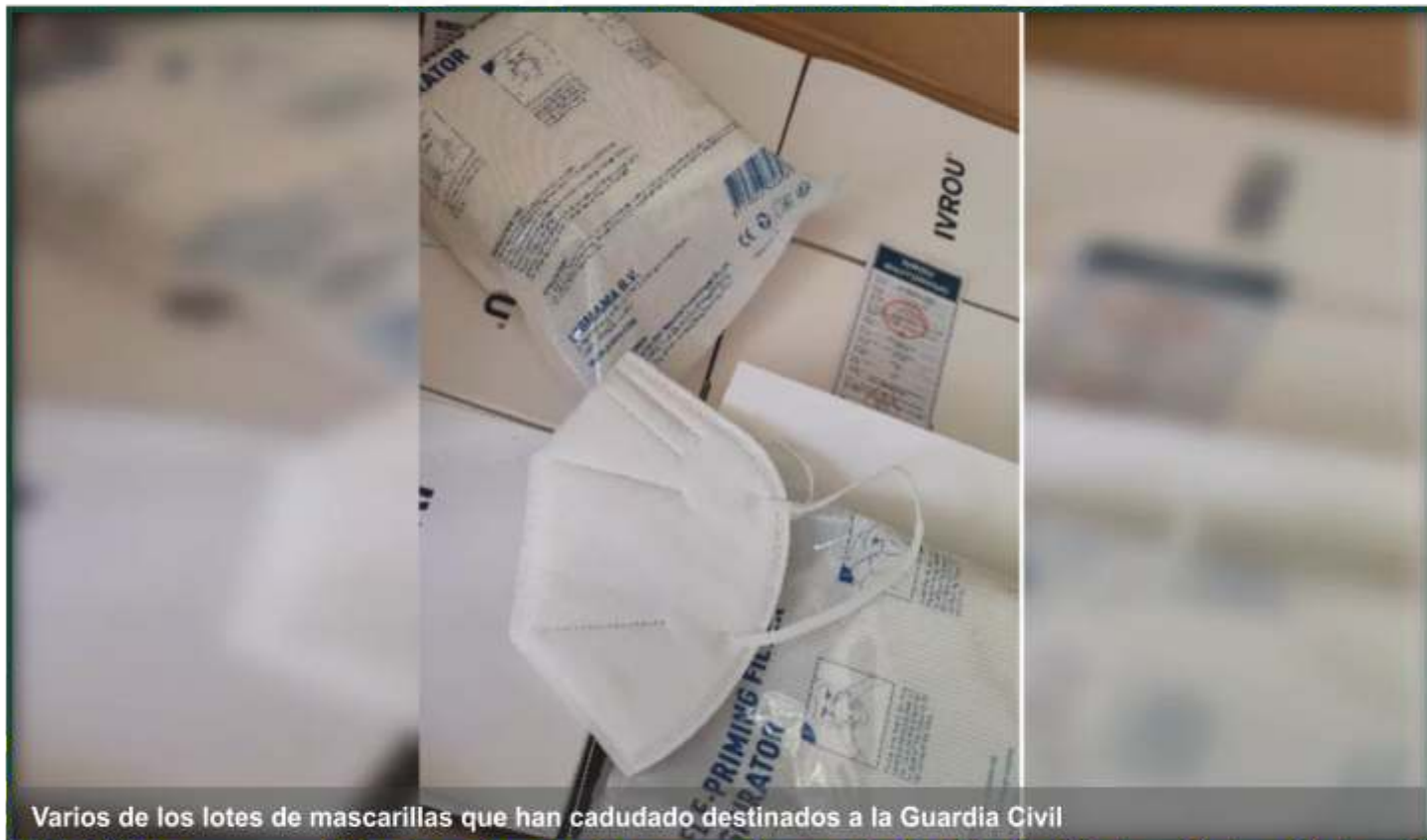
Varios de los lotes de mascarillas que han caducado destinados a la Guardia Civil

- La Asociación Democrática de Guardias Civiles (ADGC) denuncia que miles de mascarillas chinas compradas por Carolina Darías se van a tirar "a la basura" al haber caducado.