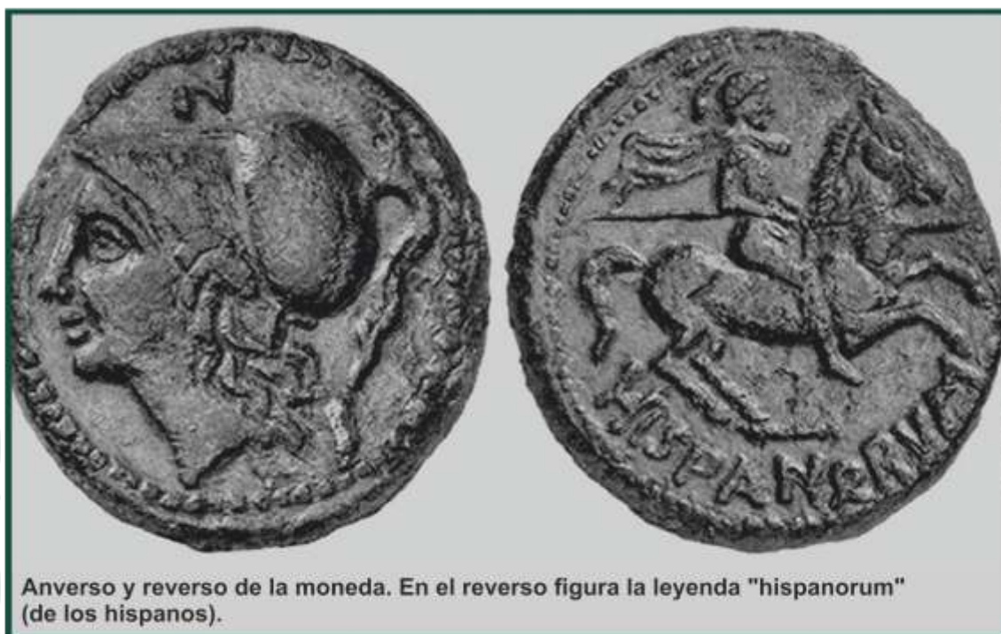
Anverso y reverso de la moneda. En el reverso figura la leyenda "hispanorum" (de los hispanos).

Este año, la convención, que se celebra durante el sábado, contará con expositores de Valladolid, Cartagena, Barcelona, Vigo, Barcelona, Oporto o Valencia.