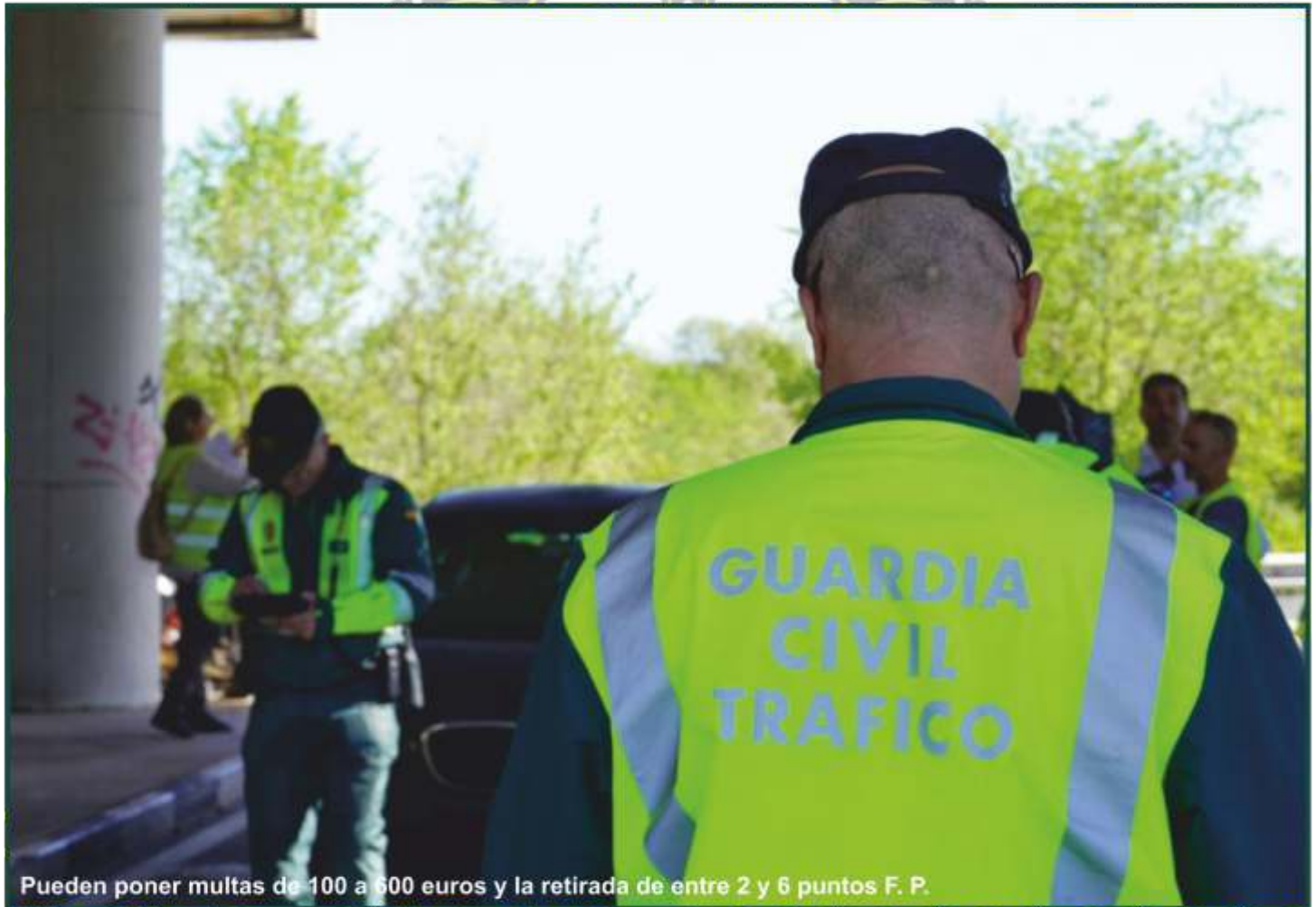
Pueden poner multas de 100 a 600 euros y la retirada de entre 2 y 6 puntos F. P.

- Cada vez disponen de mecanismos más sofisticados que hacen que la velocidad se capte de manera más precisa, aunque se mantienen los actuales márgenes de error.