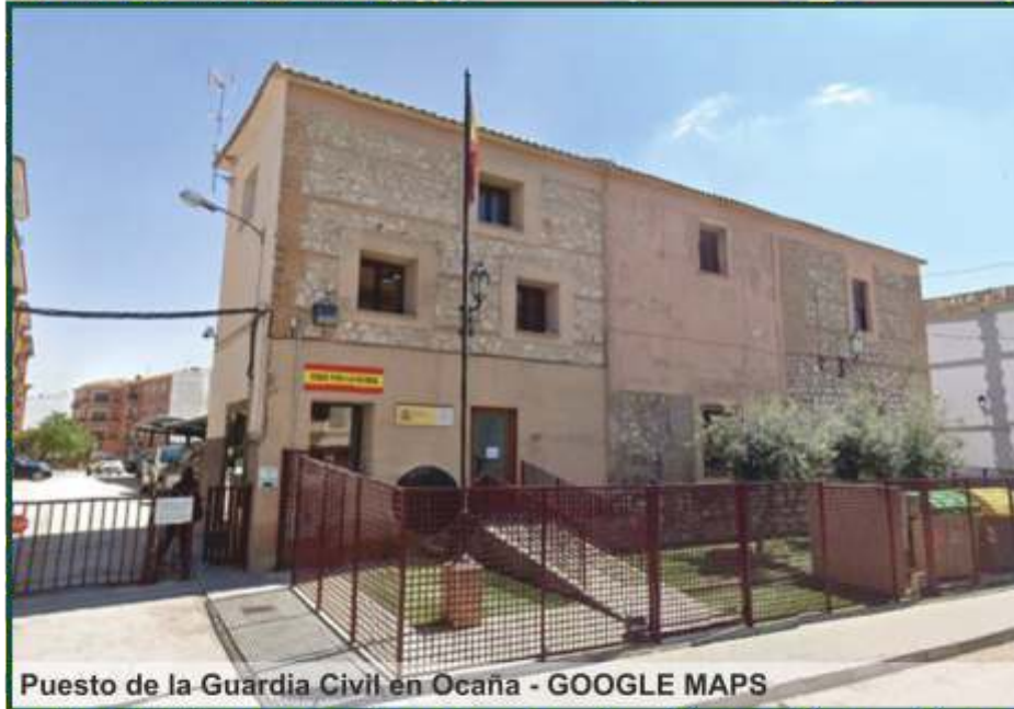
Puesto de la Guardia Civil en Ocaña

- Lleva al menos tres años al frente del cuartel toledano y tiene a su cargo cerca de una treintena de agentes.