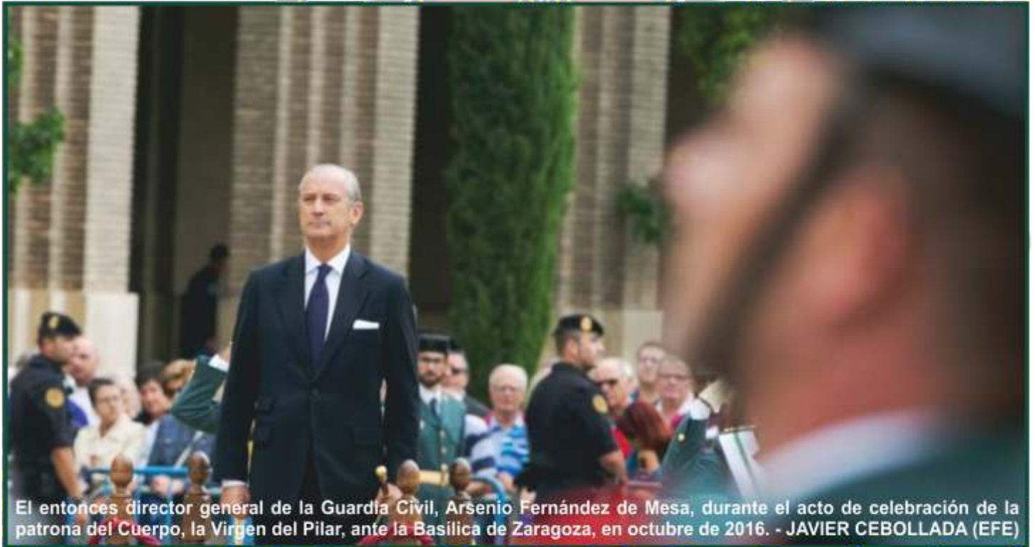
El entonces director general de la Guardia Civil, Arsenio Fernández de Mesa, durante el acto de celebración de la patrona del Cuerpo, la Virgen del Pilar, ante la Basílica de Zaragoza, en octubre de 2016.

- La empresa Eliminialia intentó borrar de internet una veintena de noticias críticas del exdiputado del PP en una decena de medios.