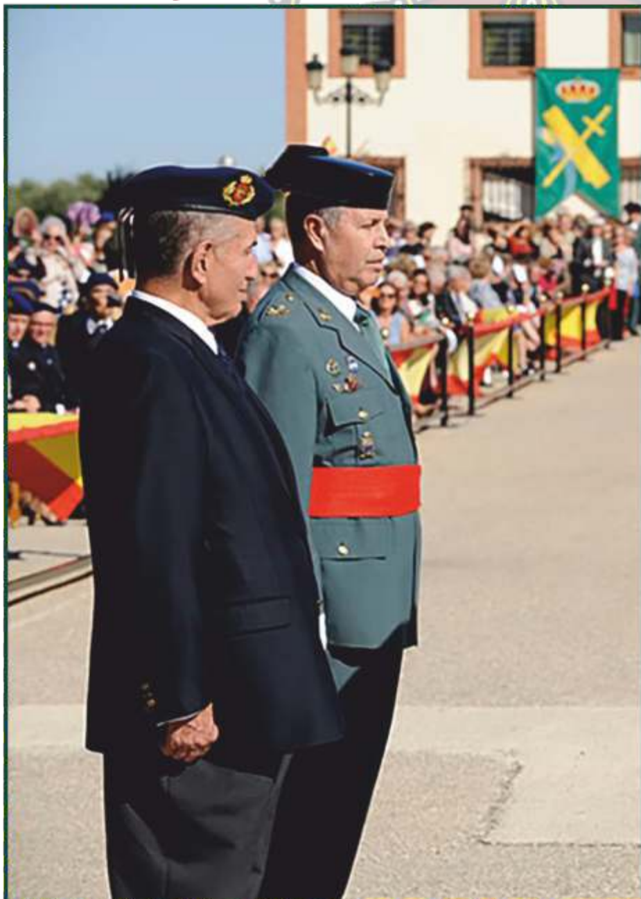
El general Vázquez Jarava, a la derecha, en un acto de la Guardia Civil en 2014 en el que se le impuso la Cruz al Mérito.

- Vázquez Jarava consiguió que un informe de Asuntos Internos que denunciaba irregularidades fuera archivado y no se enviara a la Fiscalía.