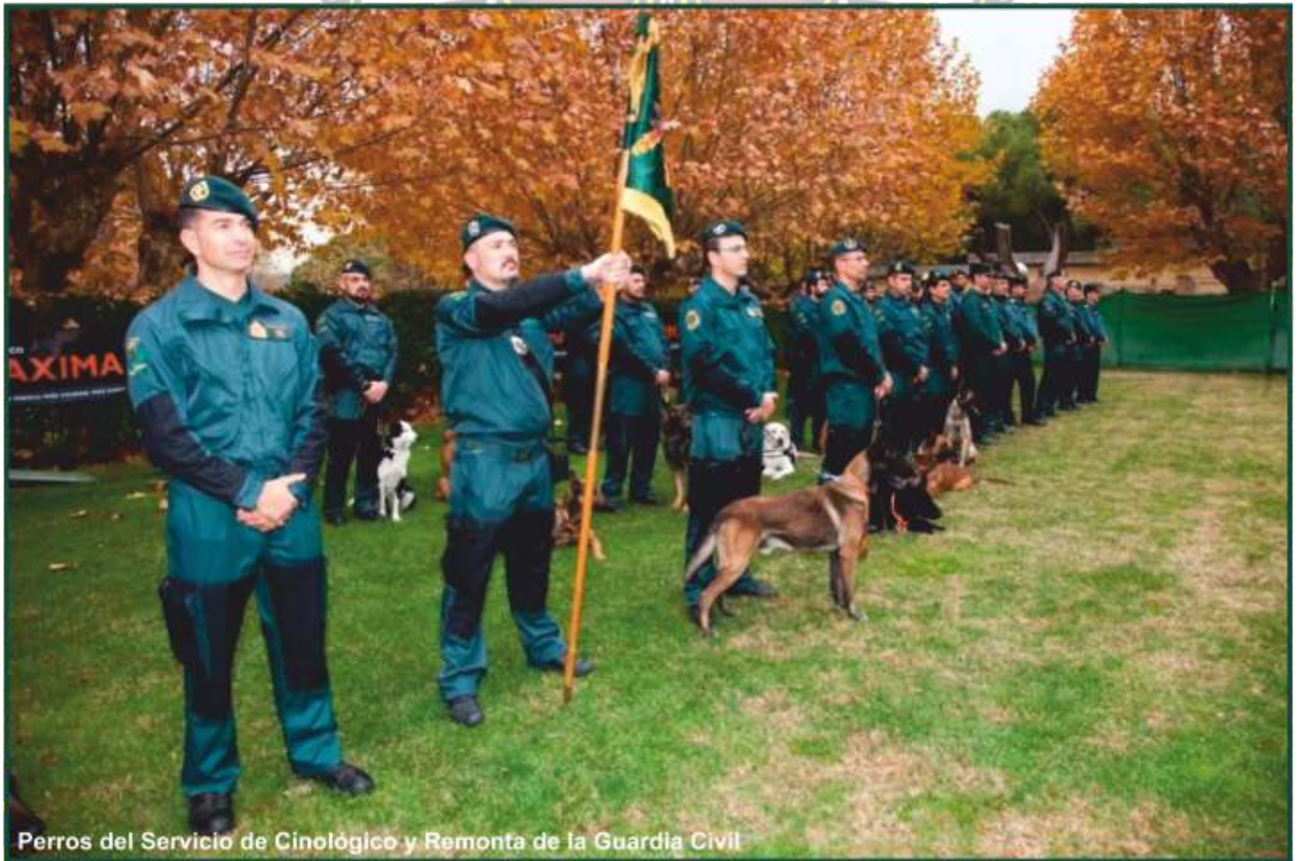
Perros del Servicio de Cinológico y Remonta de la Guardia Civil

- Licitó un contrato para adquirir estos canes de las razas pastor alemán, pastor belga 'manilois' y labrador 'retriever'. Reconoce que cada año pierde 90 animales por fallecimiento o enfermedad.