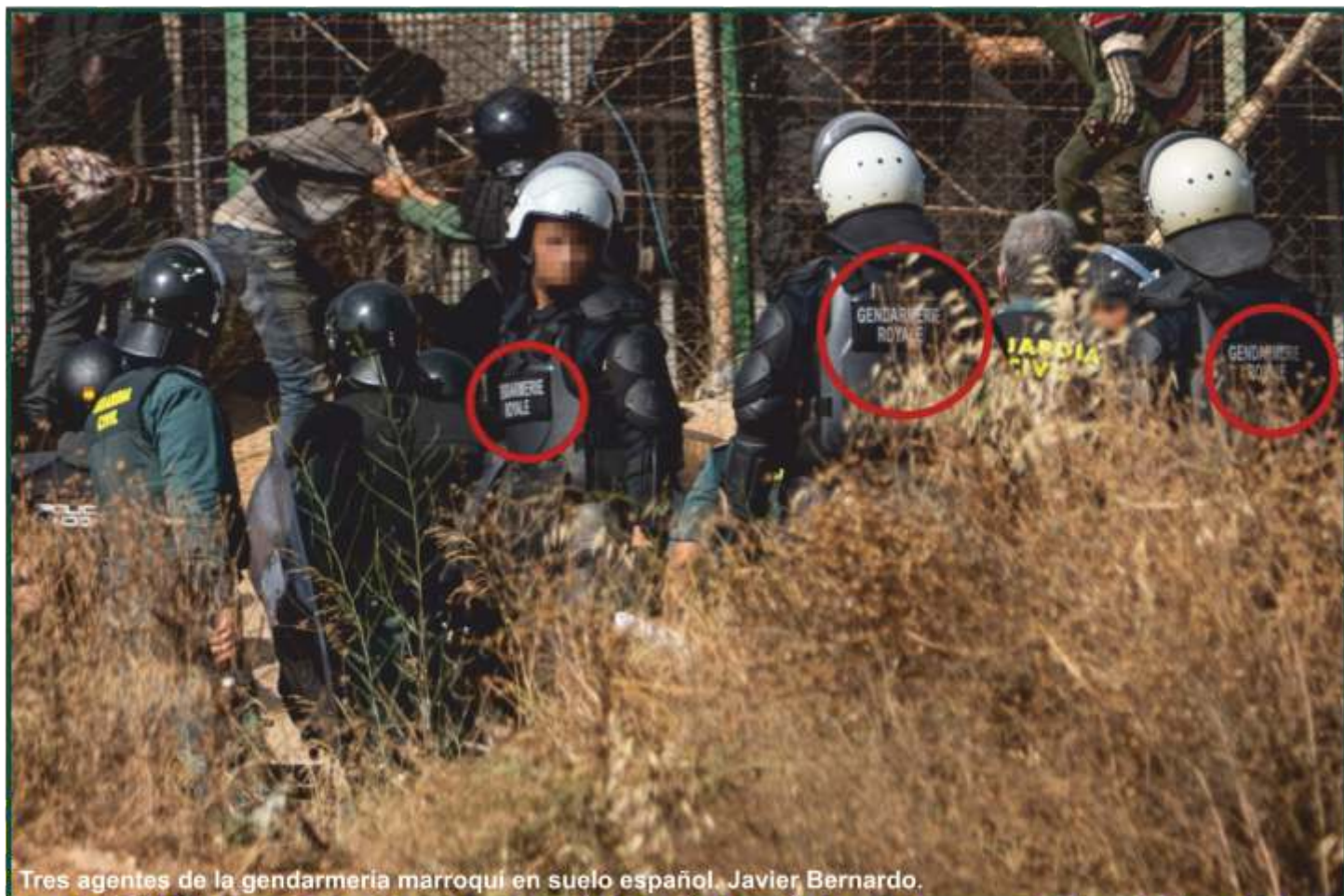
Tres agentes de la gendarmería marroquí en suelo español. Javier Bernardo.

tiendes que hacer. Tú piensa que ahora se han puesto un poco las pilas, pero en 2012 y 2013, con los primeros saltos, no sabíamos ni qué hacer ni qué nada. Sobre la marcha nos decían devolvedlos y abríamos las puertas y los pasábamos. Con las mujeres era salvaje", relata el agente número 2.