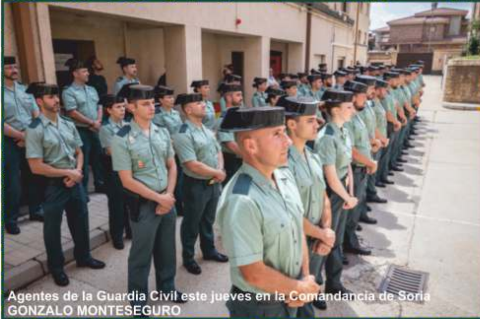
Agentes de la Guardia Civil este jueves en la Comandancia de Soria GONZALO MONTESEGURO

-A la Compañía de Soria se destinan 15, a la de Almazán 14 y a la de El Burgo 11.