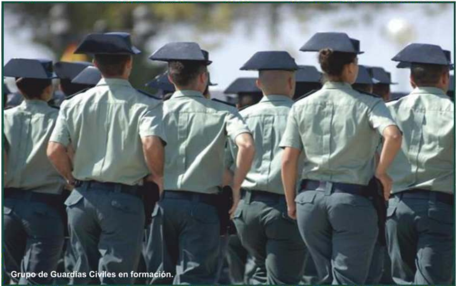
Grupo de Guardías Civiles en formación.

- La imputación de siete mandos y el deterioro de la imagen del cuerpo impulsan a una renovación Impensable hace meses.