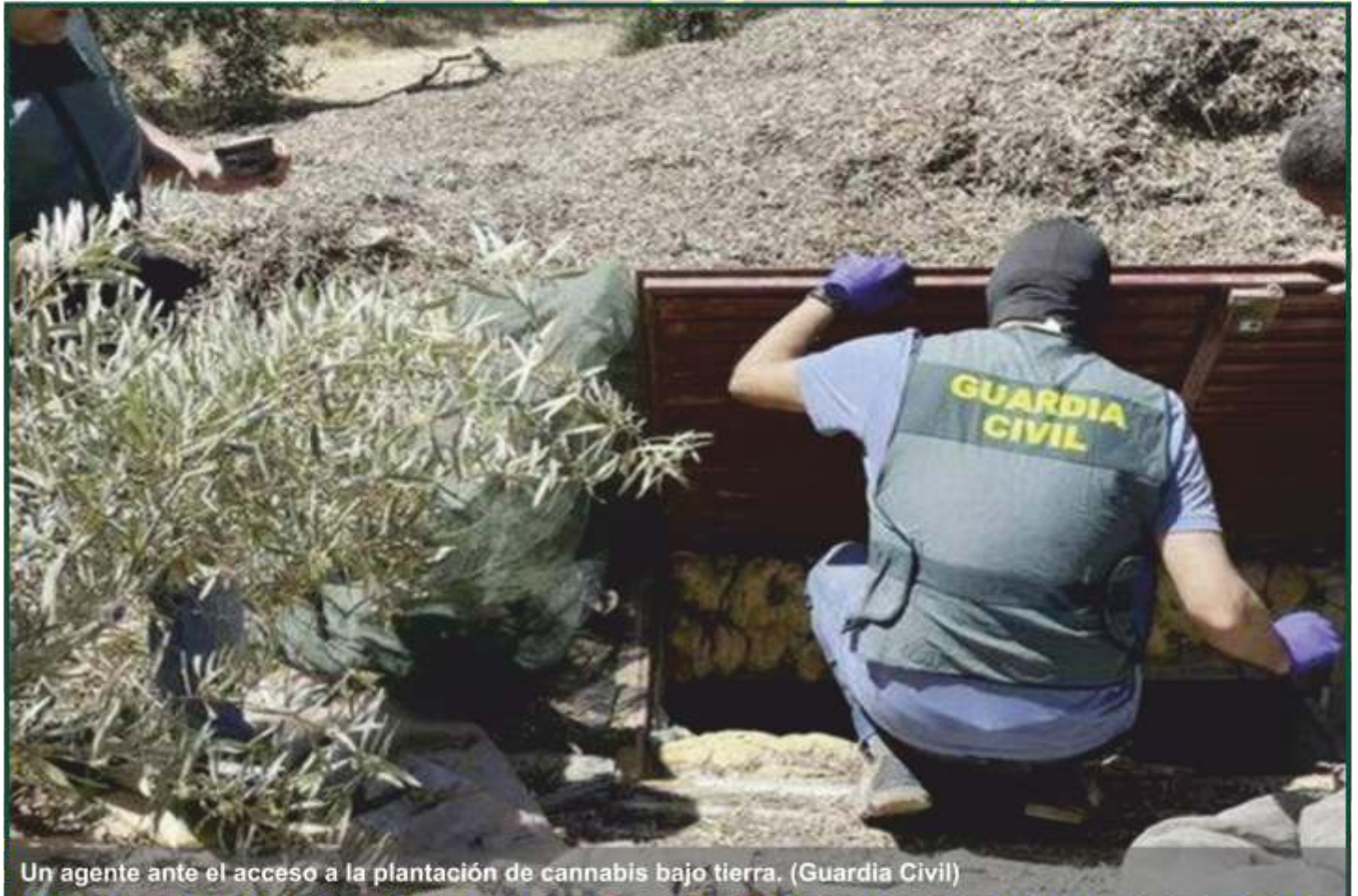
Un agente ante el acceso a la plantación de cannabis bajo tierra.

- La Guardia Civil arresta en un pueblo de Granada a un individuo que también ejercía como guarda de coto por la muerte de dos perros. Usaba un insecticida prohibido y en su casa tenía casi 300 plantas de marihuana.