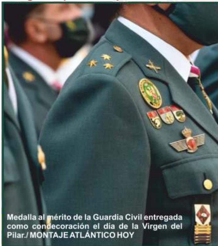
Medalla al mérito de la Guardia Civil entregada como condecoración el día de la Virgen del Pilar./ MONTAJE ATLÁNTICO HOY

- Entre los requisitos se ha especificado que las medallas en la escala de guardia se otorgarán a dos agentes que sean mujeres.