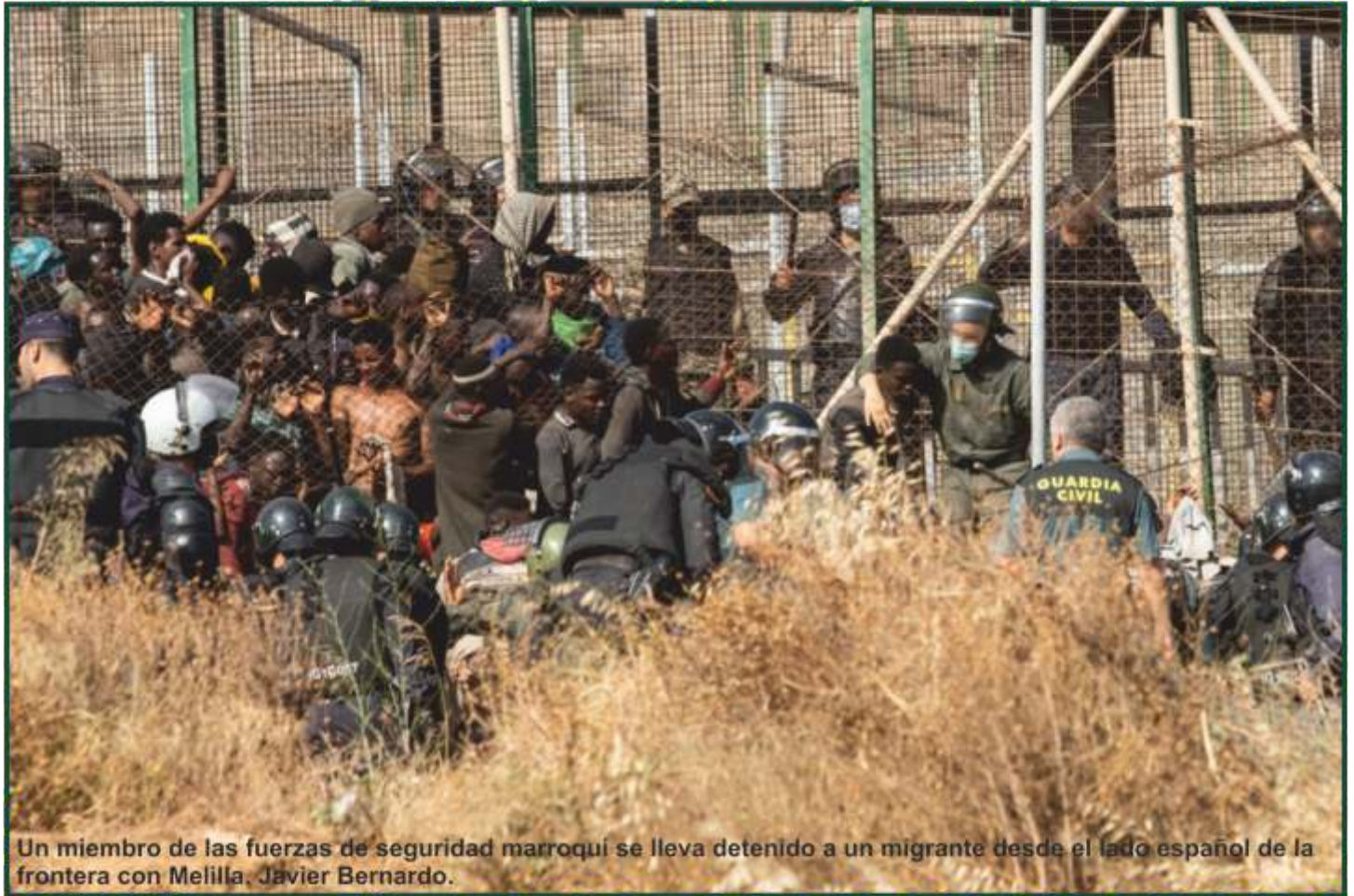
Un miembro de las fuerzas de seguridad marroquí se lleva detenido a un migrante desde el lado español de la frontera con Melilla. Javier Bernardo.

- 'Público' y 'Fundación porCausa' recaban los testimonios de cinco guardias civiles que, por primera vez, cuentan lo que vivieron en la valla de Melilla el 24 de junio de 2022.