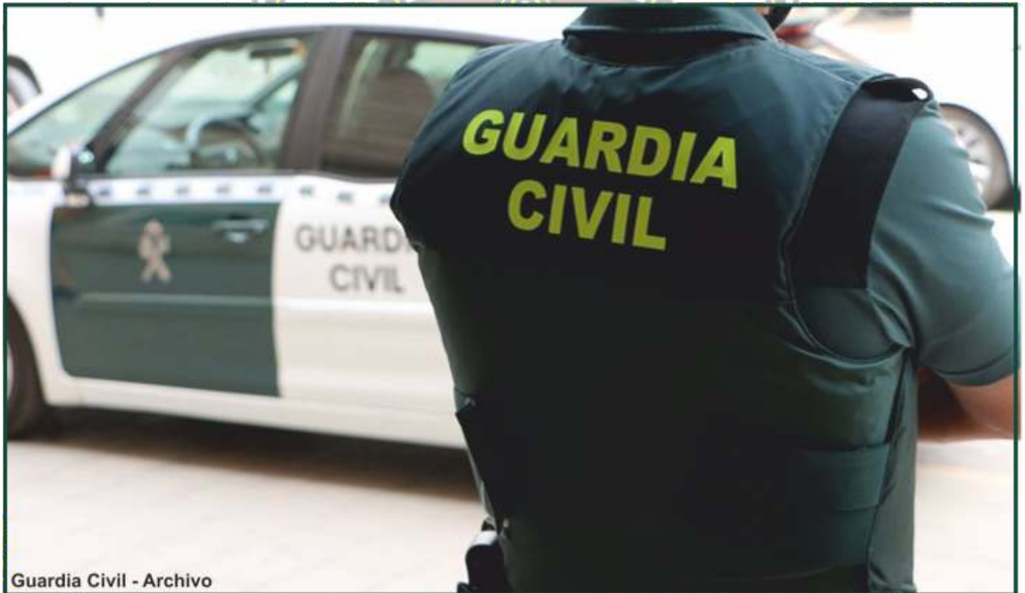
Guardia Civil - Archivo

- En los últimos 10 años la Policía Nacional ha tenido 4.000 plazas más de empleo público que el Instituto Armado.