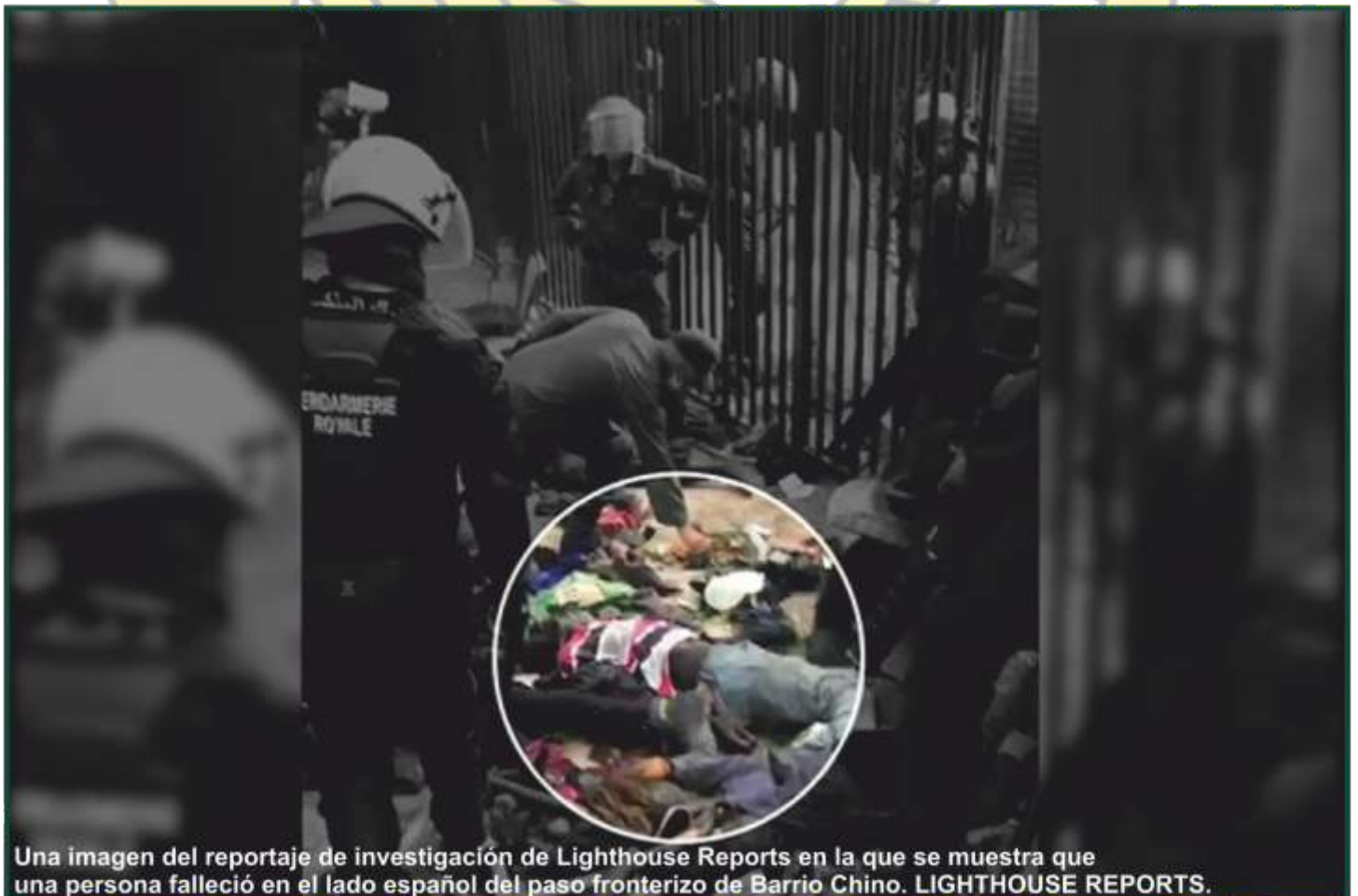
Una imagen del reportaje de investigación de Lighthouse Reports en la que se muestra que una persona falleció en el lado español del paso fronterizo de Barrio Chino.

Este agente cree que todo hubiera sido peor si la puerta hubiera estallado cuando estaban los guardias dentro del paso fronterizo, armados con su pistola reglamentaria y viéndose en una situación de vida o muerte ante cientos de personas desesperadas por entrar: "A la virgen del Pilar, que es a la que le pido de vez en cuando, no sabes ni