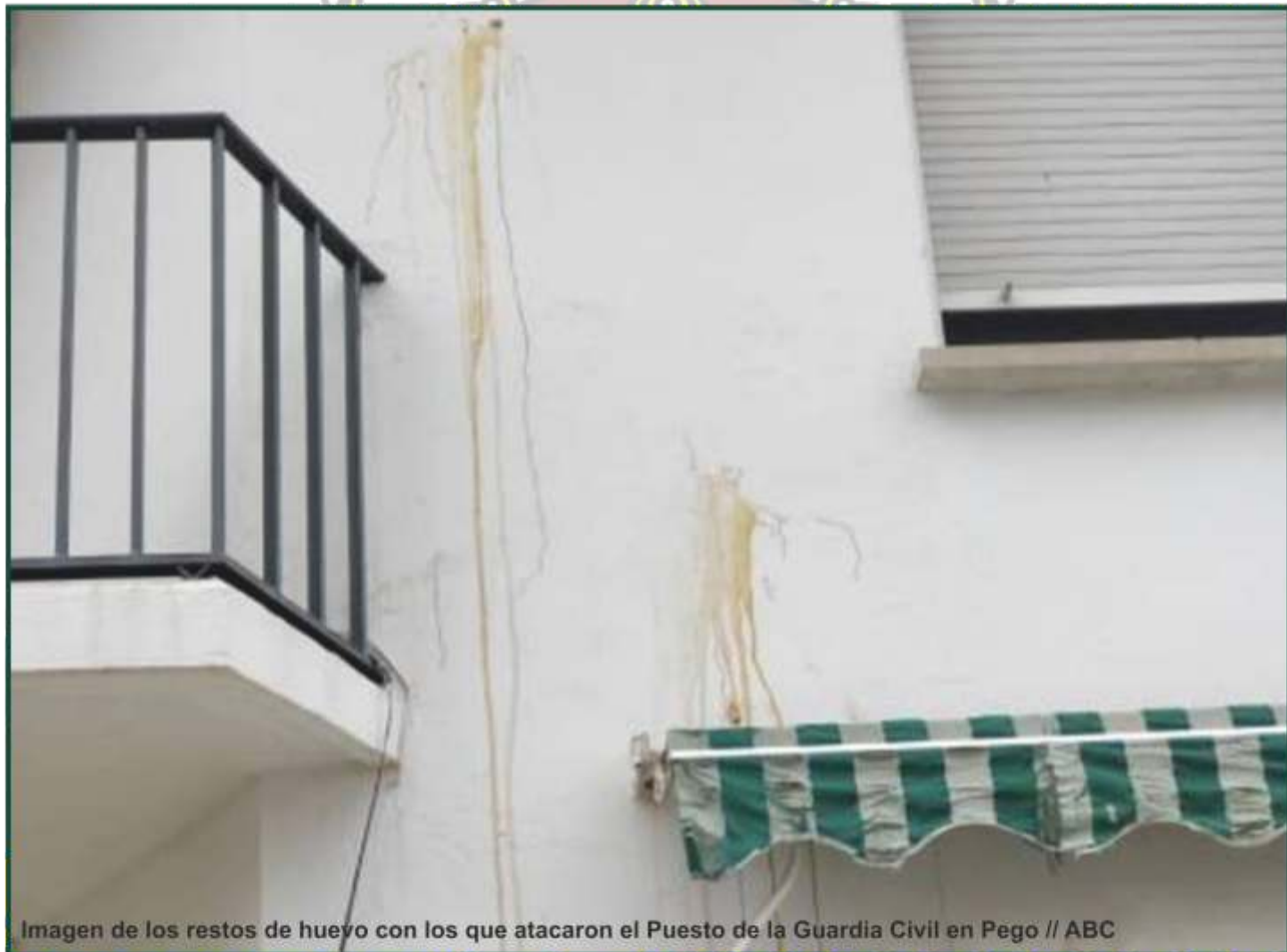
Imagen de los restos de huevo con los que atacaron el Puesto de la Guardia Civil en Pego

- La Asociación Democrática de Guardias Civiles ha denunciado la falta de medidas de seguridad en varios de sus Puestos en la provincia tras estas agresiones.