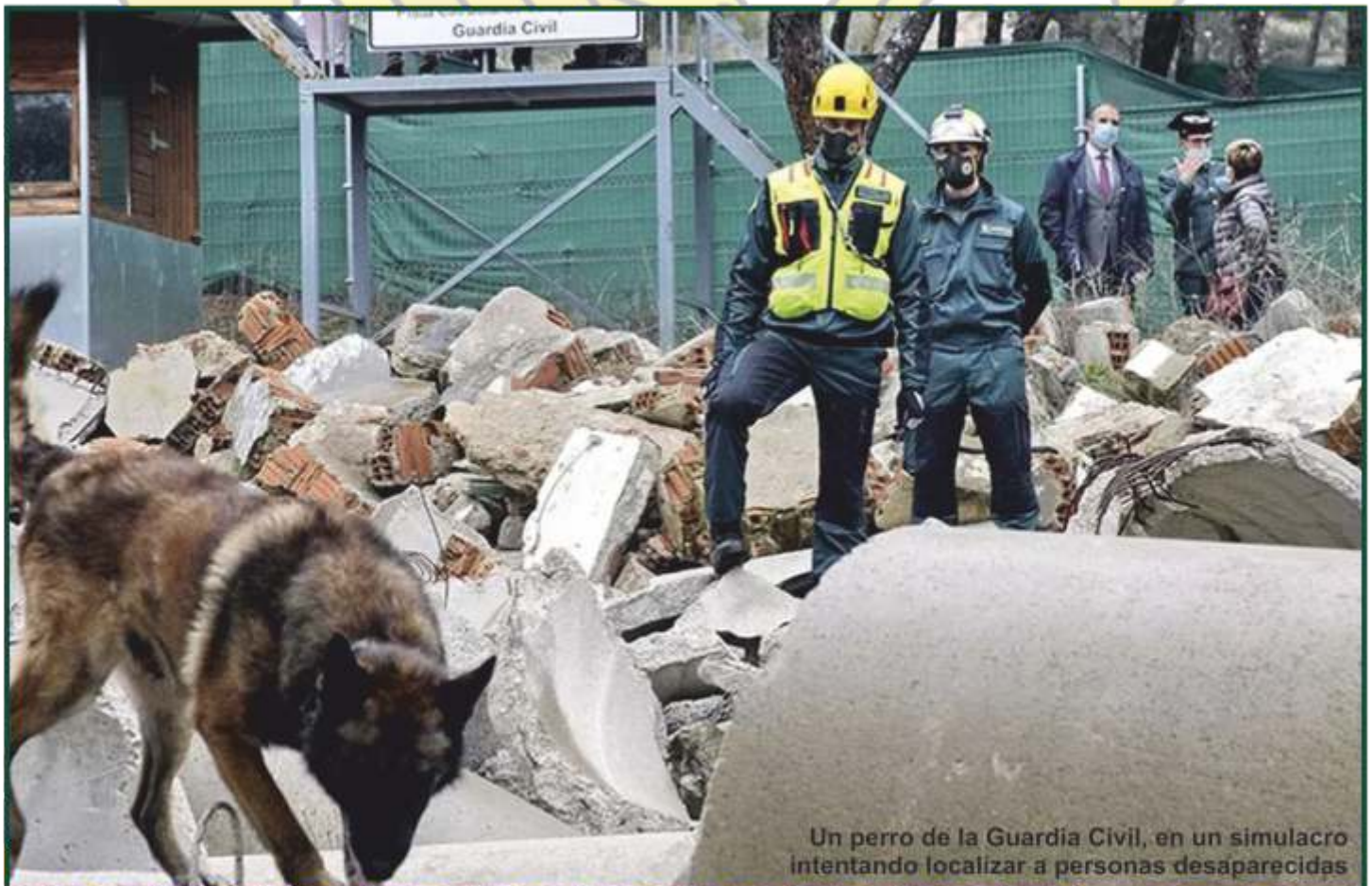
Un perro de la Guardia Civil, en un simulacro intentando localizar a personas desaparecidas

El Servicio Cinológico y Remonta se creó en 1982 y tiene su sede en Madrid. Debido a la pérdida de facultades y a los achaques propios de la edad, los perros se jubilan al cabo de unos ocho o nueve años de servicio . Cuando el animal pertenece a la Administración, normalmente se lo queda su guía o, si no es posible, se ofrece en adopción.