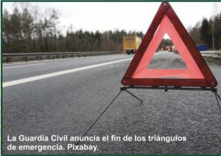
La Guardia Civil anuncia el fin de los triángulos de emergencia.

- Los triángulos de emergencia han dejado de ser obligatorios en las carreteras españolas desde este mes de julio y habrá que sustituirlos por la señal luminosa V16.